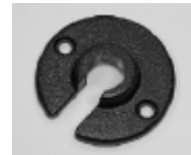
Montageplatte (zum Anschrauben bzw. Dübeln. Leuchte wird dann auf dieser montierten Platte aufgeschraubt.)