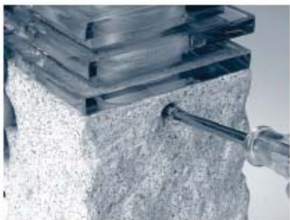
1. Sicherungsschraube des Kopfteil lösen