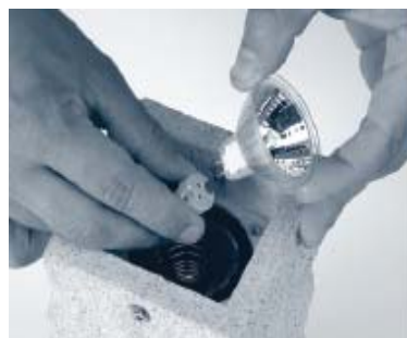
6. LED-Einheit abziehen und neue Einheit aufstecken.