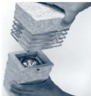
2. Kopfteil abnehmen