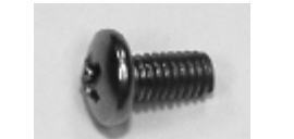
Schrauben für Glas