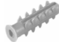
Dübel für Schrauben der Montageplatte