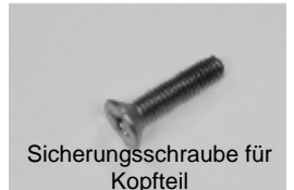
Sicherungsschraube für Kopfteil