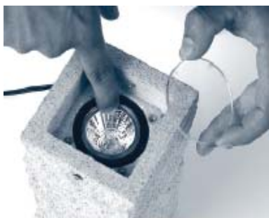
5. Glasscheibe und Dichtungsgummi abheben