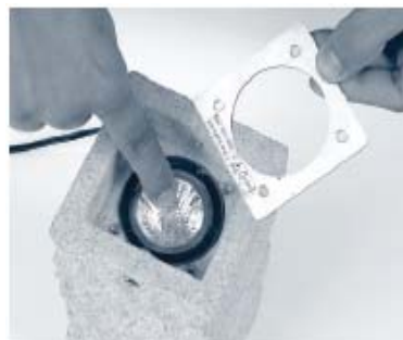
4. Dichtungsplatte abheben