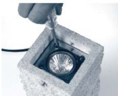
3. Schrauben der Dichtungsplatte entfernen