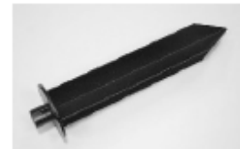
Erdspeiß (wird unten an der Leuchte aufgeschraubt)