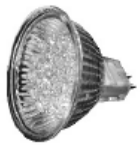
LED-Lampe (als Zubehör im Nachkauf erhältlich)